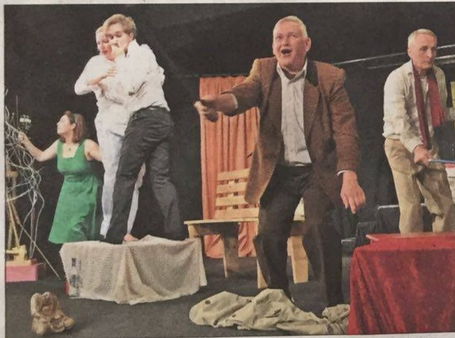
Am Ende ist das Chaos perfekt – dank Stromausfall und überraschenden Besuchern im „Dunkeln“.